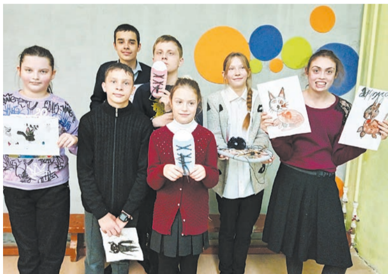
Участники проекта «Особенные встречи» создают из бросового материала методические пособия

После установки оборудования в следующем году «особенные встречи» в клубе «Позитив» станут ещё увлекательнее и разнообразнее.